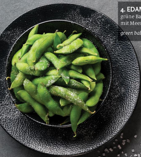
4. EDAMAME 6 5,90 € grüne Baby-Sojabohnen serviert mit Meersalz green baby-soybeans served with sea salt