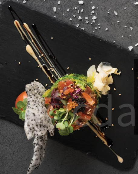
5T. TARTARE 4 10,90 € Thunfischtartar mit Avocado, mit Unagi Soße und Seetangsalat, dazu Kaviar, serviert mit vietnamesischen Banh Da Tuna tartare with avocado with unagi sauce and seaweed salad, tobiko, served with Viet- namese Banh Da 5L. mit Lachs with salmon 9,90 € 5V. vegetarisch vegetarian 7,50 €