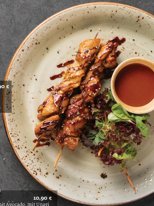
6. SMOKY SATE 57 6,90 € Gebratene Hühnerspieße mit Erdnussauce Fried chicken skewers with peanut sauce